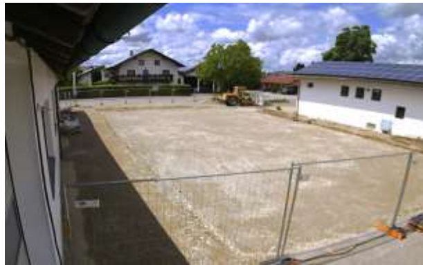
Start Baumeisterarbeiten am 18.06.2024